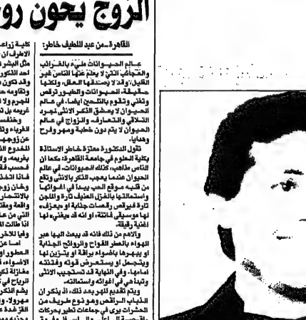
هاني شاكر